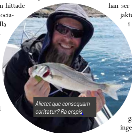
Alicet que consequam coritatur? Ra erspis