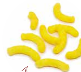
Esciis sit am nis que nit fugia