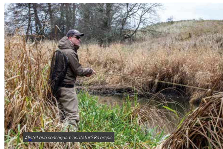
Alicet que consequam coritatur? Ra erspis

För några år sen började jag bredda mitt flugfiske ytterligare efter att jag mer eller mindre bränt ut mig själv på grund av för hårt streamerfiske efter främst havsöring. Min flugfiskesjäl var i stort behov av något nytt, något spännande och lättsamt. Min blick började riktas mot id, färna, karp, vimma, braxen och sutare. På förhand såg jag inte dessa arter som någon utmaning. Men när jag väl gjorde praktiska försök blev