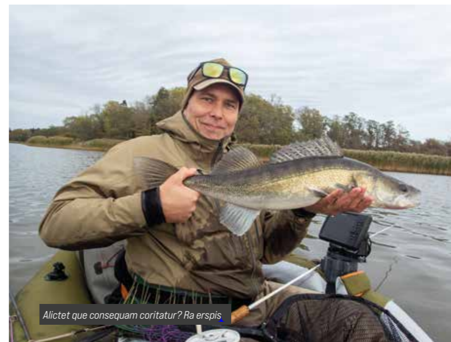
Alicet que consequam coritatur? Ra erspis

- Slätvaren har jag varit ute efter många nätter men aldrig lyckats hitta någon. Knepig. Även sandskäddan är ju rätt konstigt att jag inte lyckats med än trots flera försök.