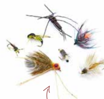
Esciis sit am nis que nit fugia