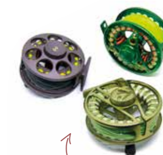
Esciis sit am nis que nit fugia