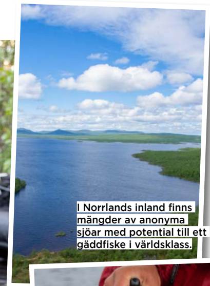
I Norrlands inland finns mängder av anonyma sjöar med potential till ett gäddfiske i världsklass.