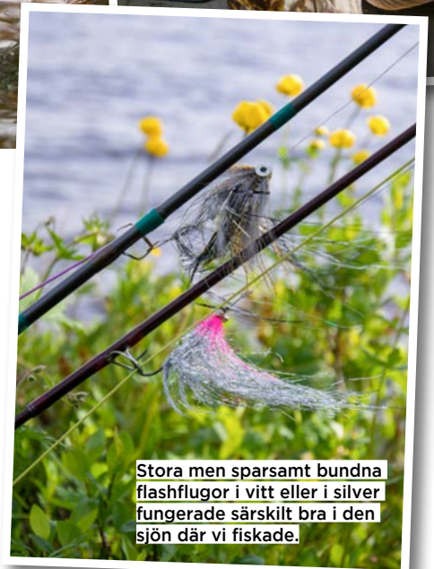
Stora men sparsamt bundna flashflugor i vitt eller i silver fungerade särskilt bra i den sjön där vi fiskade.

rovfiske pågår. Det här var gäddfiske på riktigt, rovgiriga topp-predatorer som attackerar utan att tveka. Här uppe i gränslandet mellan barrskog och tundra finns det dessutom så många oupptäckta gäddvatten att man inte skulle hinna med att utforska en bråkdel av dem under en livstid.