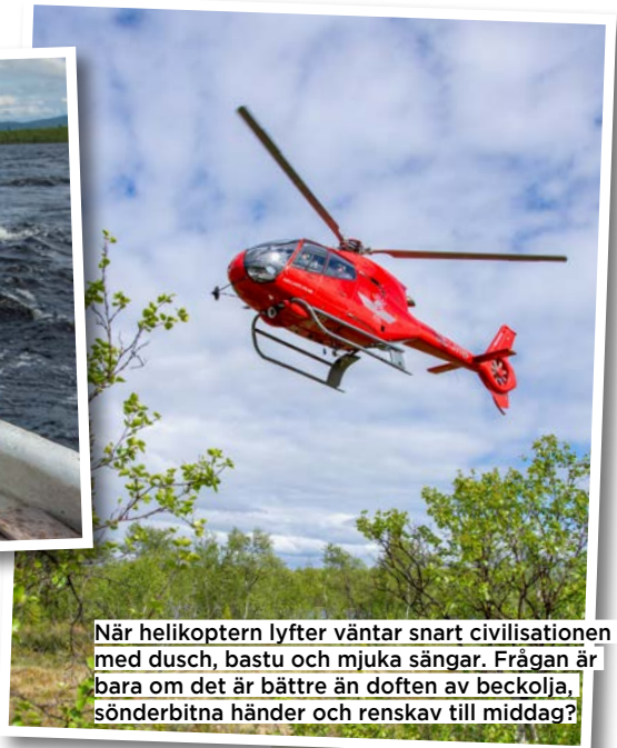
När helikoptern lyfter väntar snart civilisationen med dusch, bastu och mjuka sängar. Frågan är bara om det är bättre än doften av beckolja, sönderbitna händer och renskav till middag?