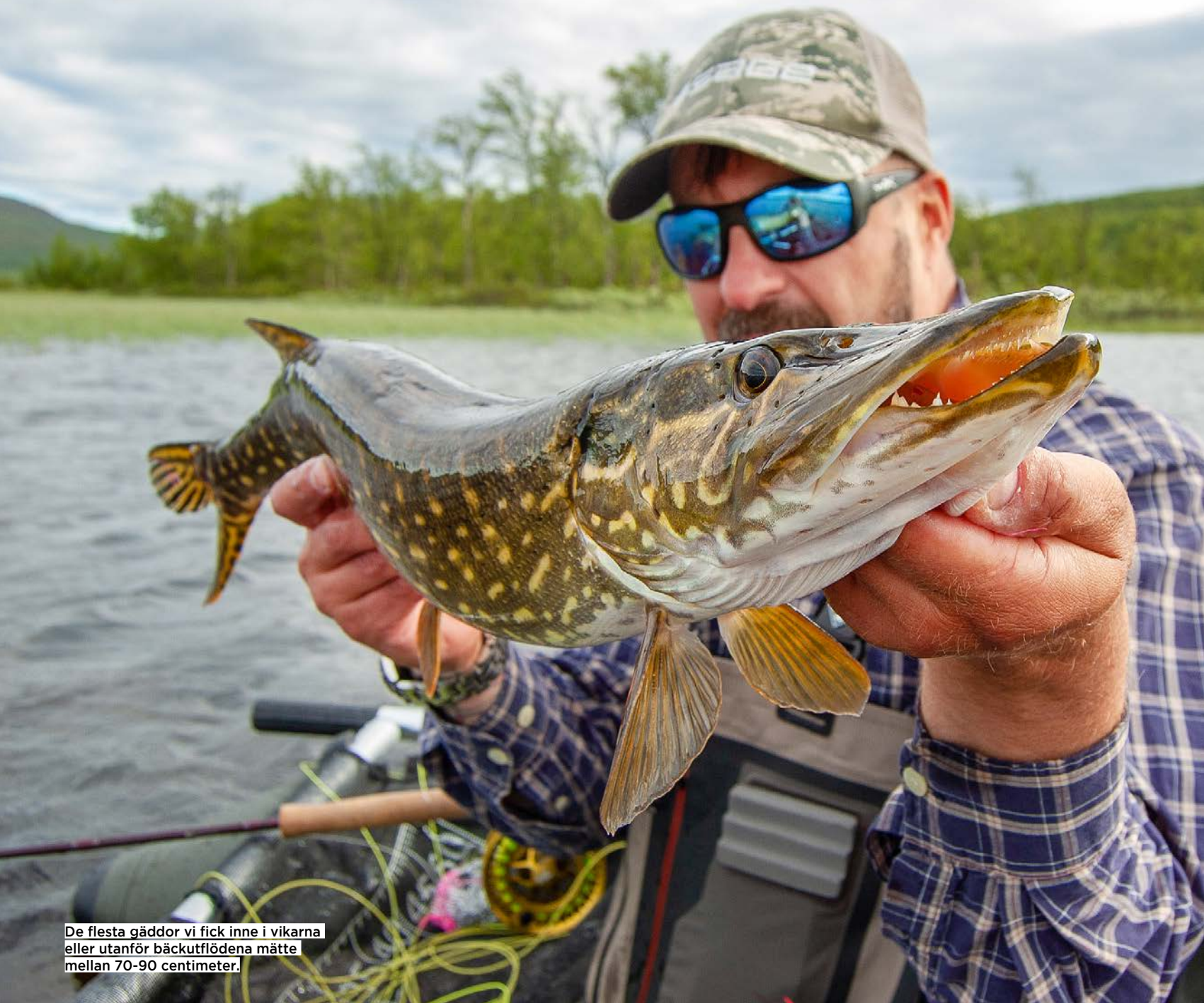
De flesta gäddor vi fick inne i vikarna eller utanför bäckutflödena mätte mellan 70-90 centimeter.