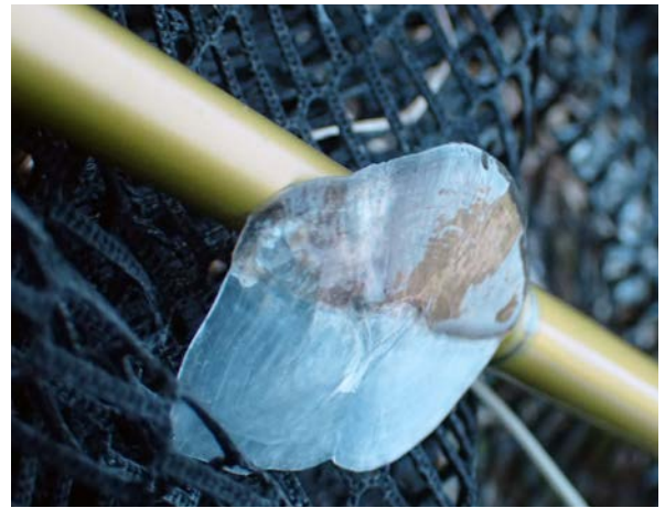
Ett fjäll blev kvar i häven som en påminnelse om dess grovlek.