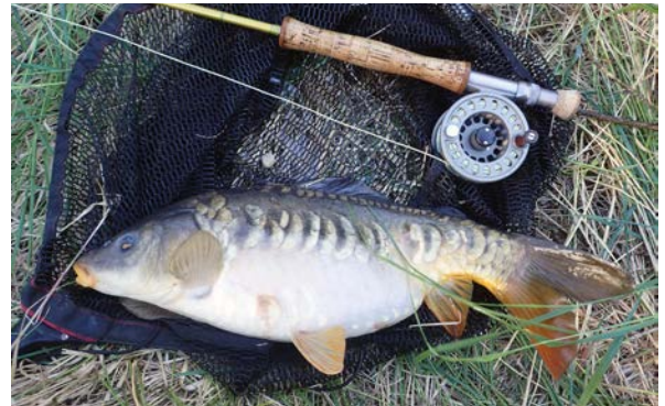
Spegelkarp, gräskarp och koikarp är vanligast i sjöarna runt Stockholm.