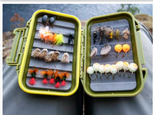
Mina flugaskar innehåller idag särskilda karpflugor som imitationer av hundmat, ostbågar eller bröd.

Vi är på karpjakt med flugspöna. Flugboxarna