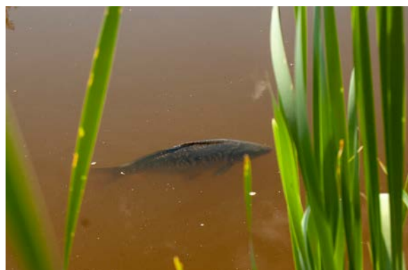
När karpnen solar i vattenytan är den lätt att upptäcka. Men genom sitt sjätte sinne är den då nästan omöjlig att lura.

mellan 0,28 -0,40 millimeter standard, beroende på flugval förstås. Trots att vi under resten av sommaren steppat upp till max, både vad det gäller indiansmyg, fina presentationer och drillteknik lämnade vi oftast fiskepassen med armvärk och slutkörda hjärnor. Karparna ger en svår match i varje detalj och när säsongen var över kunde vi frustrerat sammanfatta våra erfarenheter med att vi inte kunde ett skit om karpfiske. Vi känner framförallt inte igen beskrivningarna från England och USA, deras karpar verkar vara av en helt annan sort. Enkla, hungriga och obrydda av yttre faktorer som fåglar och ljud. Våra specialflugor fungerar dessutom inte för fem öre och karpnen i Stockholm verkar till och med skygga för ljudet av rullknarr när linan repas av för kast. Det är nästan läskigt, men det verkar nästan som att karpnen har ett sjätte sinne.