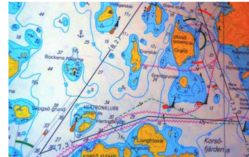
Studera sjökort för att hitta nya huggplatser.

Med stor mångfald i asken finns risken att du kommer förvirra bort dig och fundera på flugval mer än att fundera på hur du ska hitta fisken.