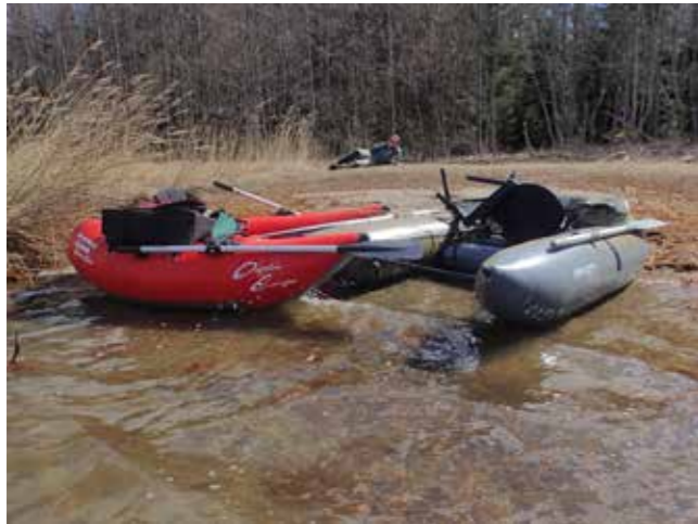
Pontonbåt och flytring ger dig bättre möjligheter att nå fisken.