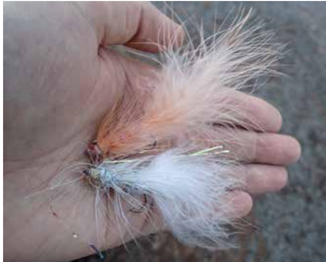
Flugor med liv och rörelse är ett säkert kort i flugasken.