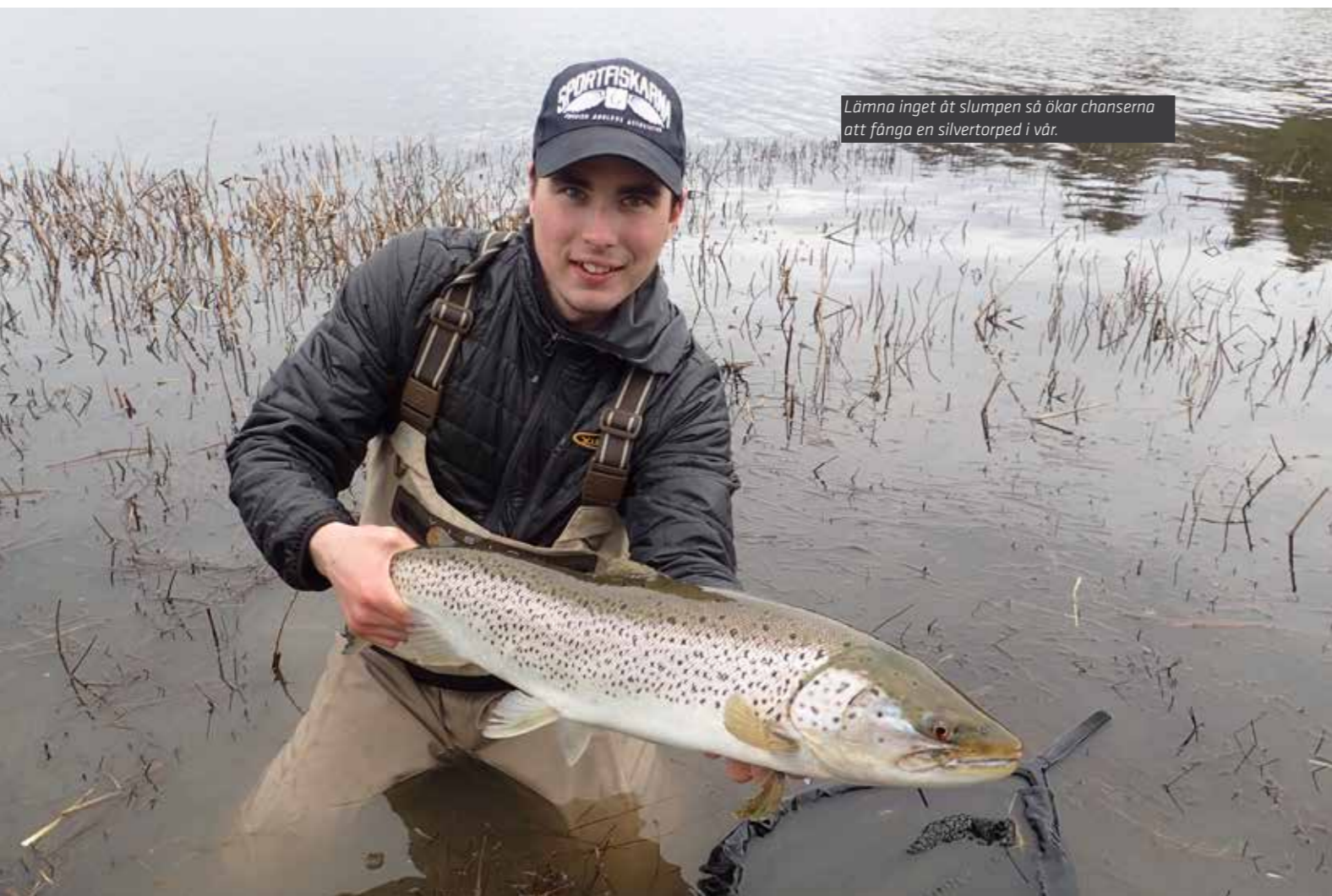
Lämna inget åt slumpan så ökar chanserna att fånga en silvertorped i vår.