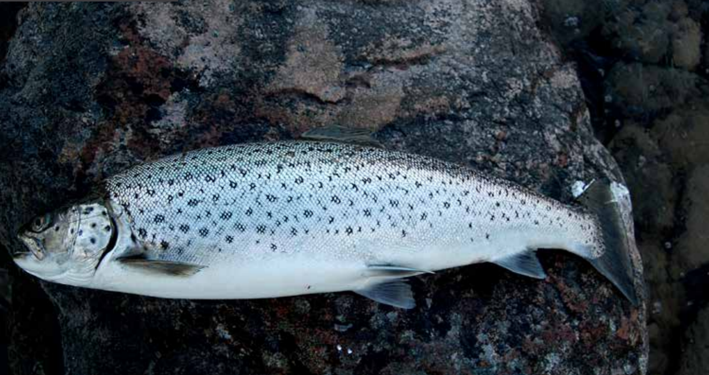
En fet våröring från Stockholms yttre skär.