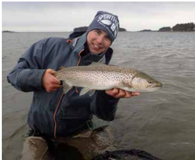
Fiskelycka! En solig dag som övergick till mulet triggade igång öringen att hugga.

Med risk för att låta tråkig är mitt tips för ett lyckat vårfiske är att fokusera på vilka bytesdjur som finns i ditt område samt att du binder upp några få och enkla mönster som uppfyller kriterierna – form, rörelse och silhuett efter den naturliga faunan.