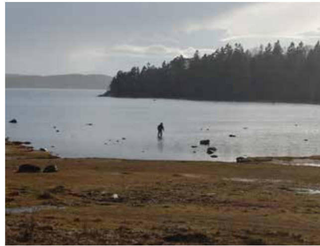
Sök vikar för att hitta varmare vatten.

Dagens klimat med internet och sociala medier ger mycket information om hur du fångar en öring. Men den bästa kunskapen finns på kusten bland öringrävarna som fiskat hela sitt liv. Enda sättet