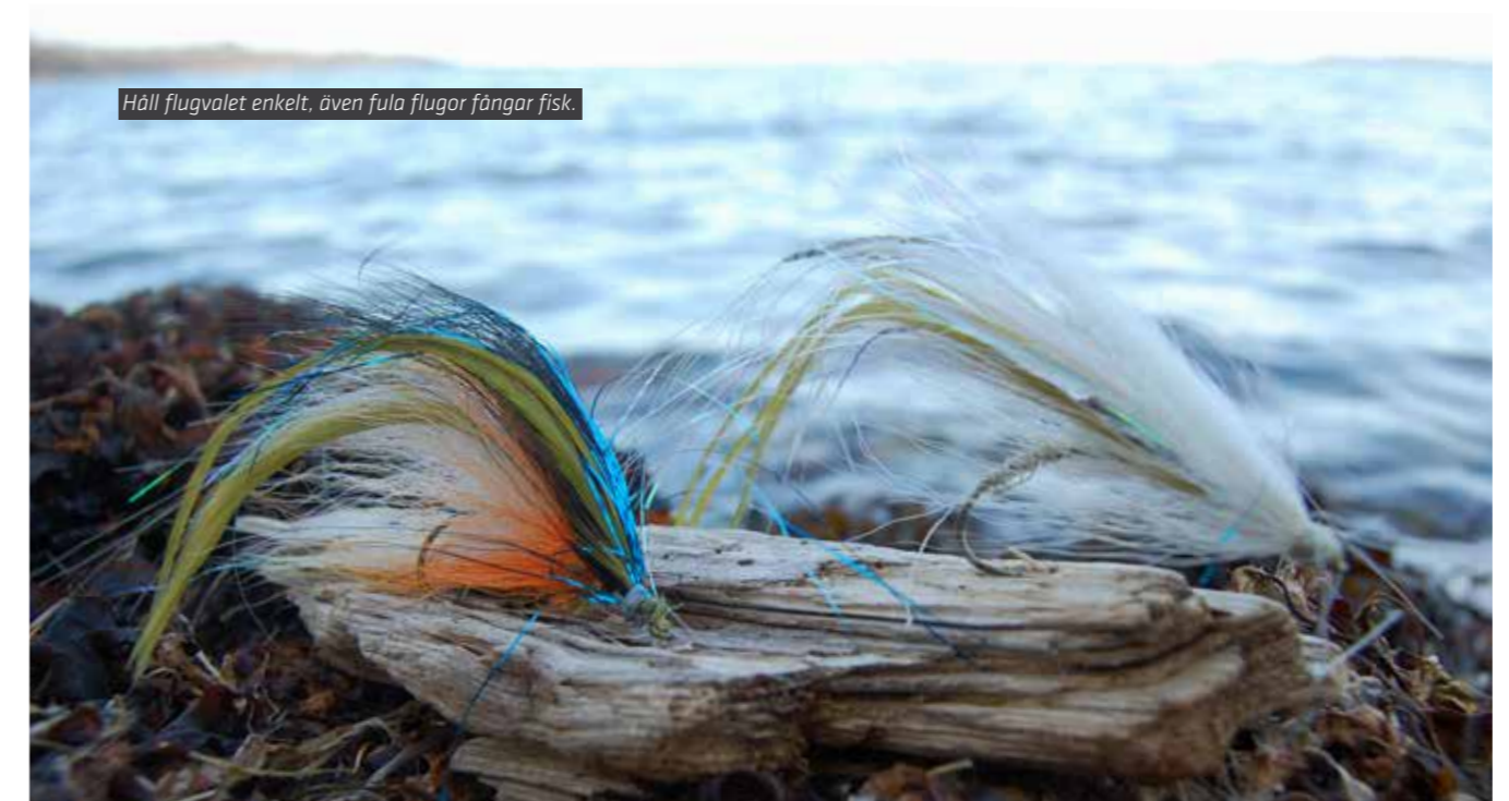
Håll flugvalet enkelt, även fula flugor fångar fisk.