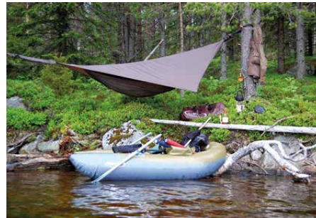
Att bo vid strandkanten är ett effektivt sätt att inte missa någon huggperiod.

Som på en given signal flyger armén ut över sjövattnets mörka yta och kraschlandar en efter en precis utanför oss på djupkanten.