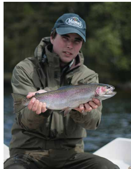
Vacker regnbåge från Sveriges västra sida.

-Solen är bakom molnen. Ser du den! Men SHMI får skärpa sig, det här vädret stämmer ju inte för fem öre, säger han på göteborgska