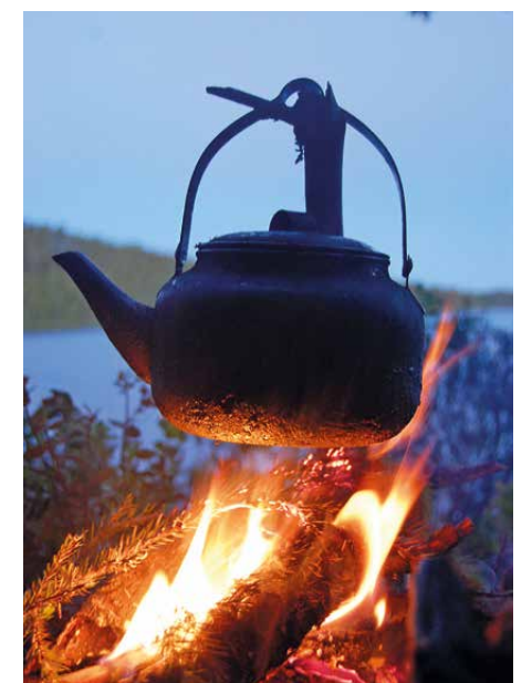
Lägerelden och kaffepannan är viktiga ingredienser för att hålla modet uppe.