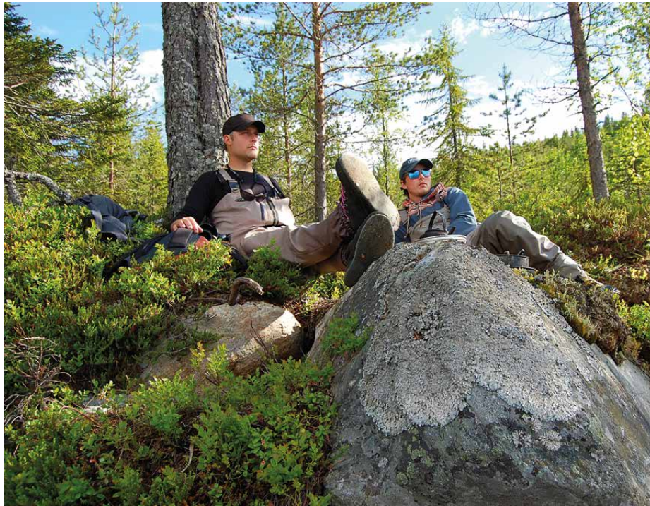
Lugnet före stormen. Många timmars väntan blir det...