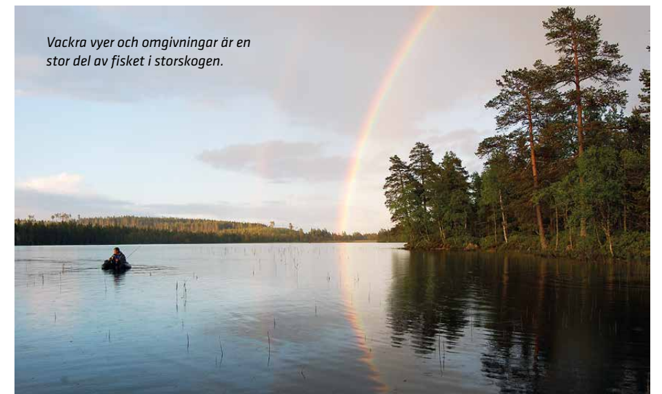
Vackra vyer och omgivning är en stor del av fisket i storskogen.

ögon. Jag la inte ens ett kast på fisken. Men så kan vulgatfisket vara när det handlar om sjöarnas största öringar. Minsta lilla avvikelse med fluglinan, fel fluga eller liten gung på vatt-net från flytringen får fisken att ana oråd och sluta äta. Du får bara en chans och det gäller att välja rätt läge.